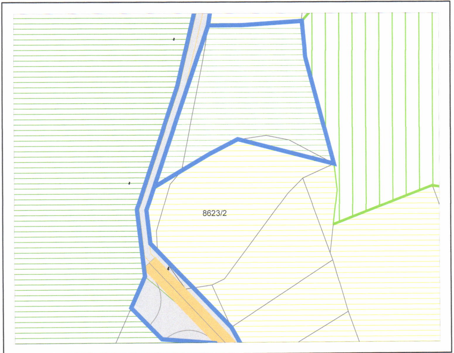
ПЛАН ГЕНЕРАЛНЕ РЕГУЛАЦИЈЕ "УЖИЦЕ - ЦЕНТРАЛНИ ДЕО" - II ФАЗА ПРЕТЕЖНА НАМЕНА ПОВРШИНА И РЕЖИМИ КОРИШЋЕЊА ПРОСТОРА карта број 4.