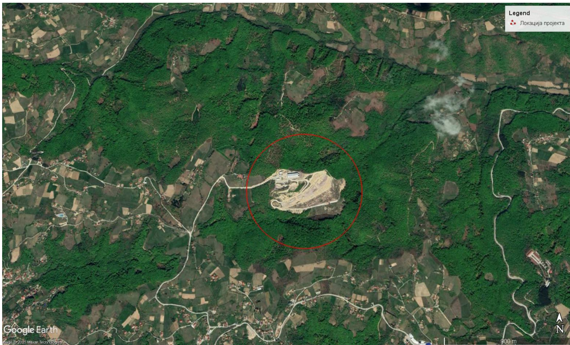
Слика 2 Локација санитарне депоније Дубоко