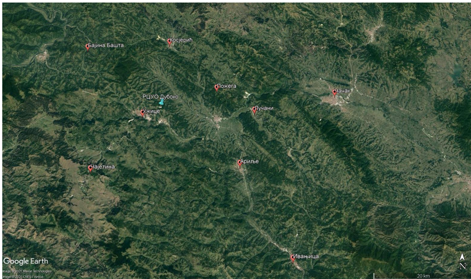
Слика 1 Локација РЦУО Дубоко