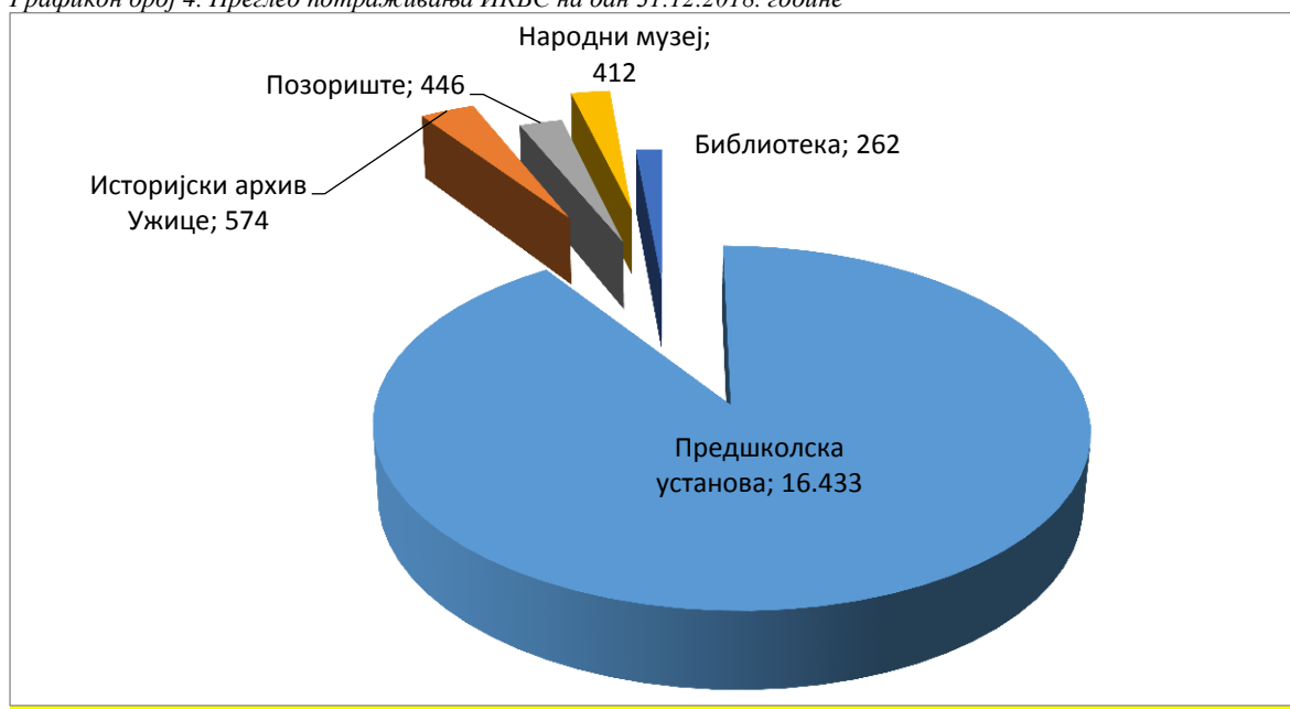
Графикон број 4. Преглед потраживања ИКБС на дан 31.12.2018. године