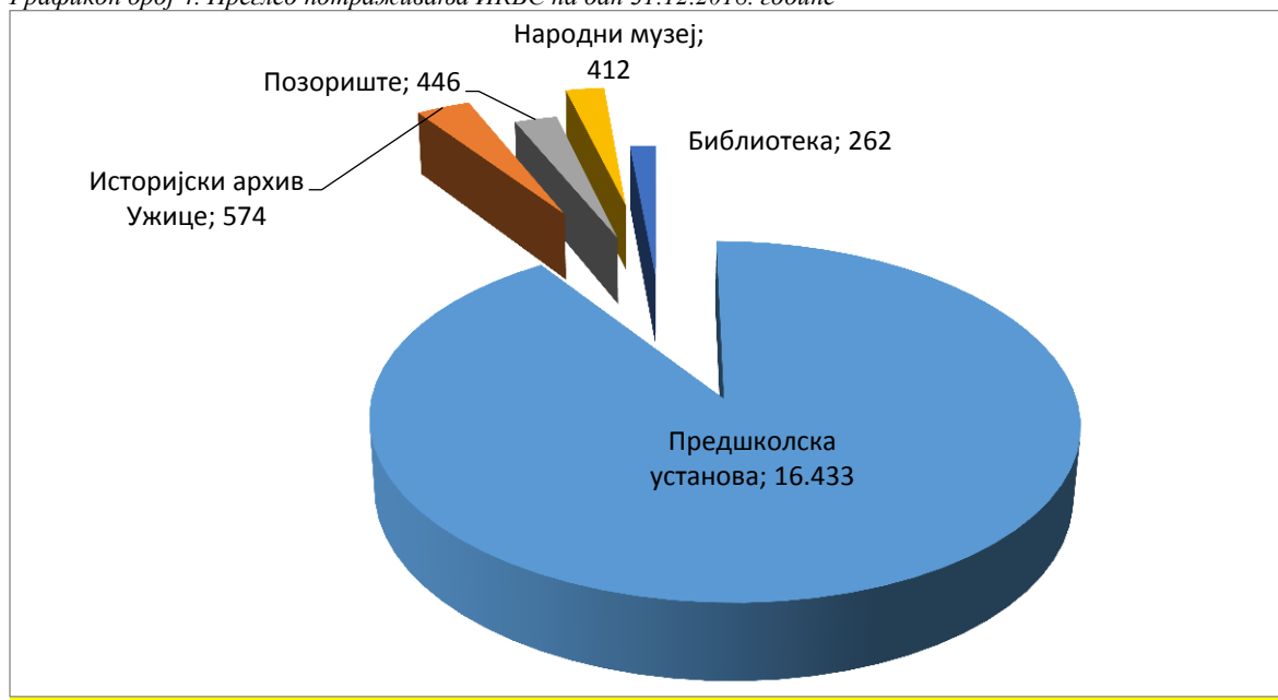
Графикон број 4. Преглед потраживања ИКБС на дан 31.12.2018. године