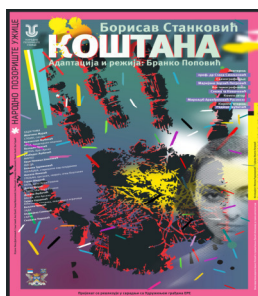
Назив пројекта: КОШТАНА – Бора Станковић

Кратак опис пројекта: Драмски текст Коштана – Боре Станковића, свакако спада у ред најзначајних текстова наше културне баштине. Цела Коштана је тужна повест згажених срца и промашених живота. Сви ти људи много се веселе, али од њих нико није весео. У свакоме од њих одиграва се вечита трагедија, стара као свет: јединка која тражи сву љубав, сву срећу, потпун, интензиван, слободан живот у средини која је безлична, неумољива, која тражи да људи подреде оно што им је најдраже њеним незнатим, хладним рачунима. Иако један од најпознатијих позоришних комада ово је комад без сложене радње који поседује снажне сукобе. Коштана је писана као комад са певањем и раскошним сликама фолклора са југа Србије и представља снажну драму људских судбина и слика појединачних патњи и колективне несреће у којој се сукобљавају две стране живота и два става према животу. Са једне стране затворени и спутан лицемерни живот ограничен патријархалним моралом који гуши младост, уништава љубав и живот чини испразним а са друге стране имамо живот испуњен радошћу и страстима.