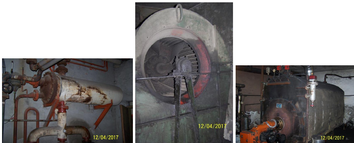
Слика 1 – Размењивач пара вода

За припрему ваздуха за велику сцену и салу постоје две клима-коморе са парним грејачима и влажењем ваздуха. Хлађење ваздуха није предвиђено.