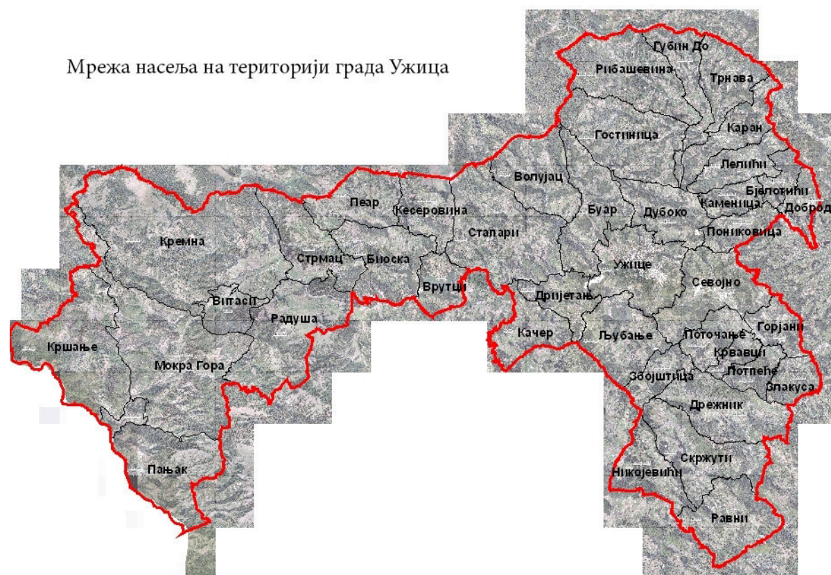
Слика 1. Скица насељених места на територији града Ужица

Град се састоји од 41 насеља, од чега 2 градска (Ужице и Севојно) и 39 сеоских насеља.