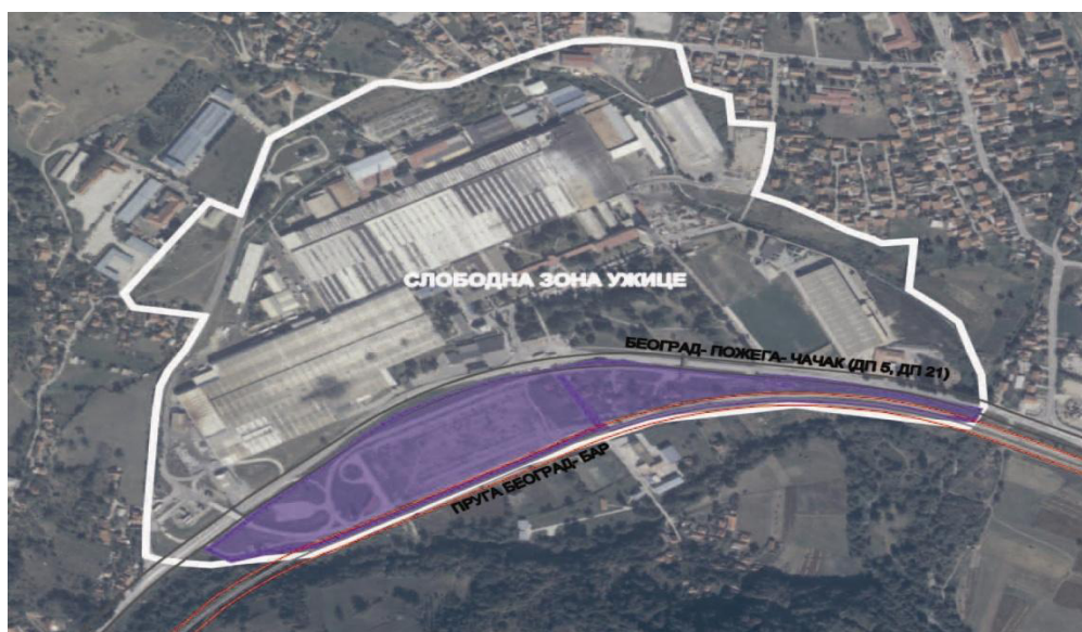
Слика 1. Једна од расположивих локација у оквиру Слободне зоне (означена бојом)

Слободна зона Ужице. Као резултат ЈПП града Ужица са Ваљаоницом бакра АД Севојно и компанијом Импол Севал АД, 2010. године формирана је Слободна зона Ужице, једна од 13 у Србији, у индустријској зони Севојно Л, поред државног пута Ужице-Београд.