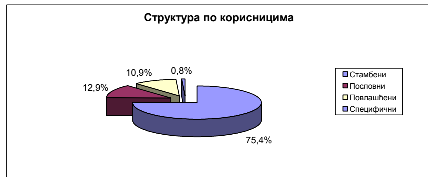
Слика бр. 2: Удео корисника по енергентима и по структури корисника у односу на укупно грејану површину