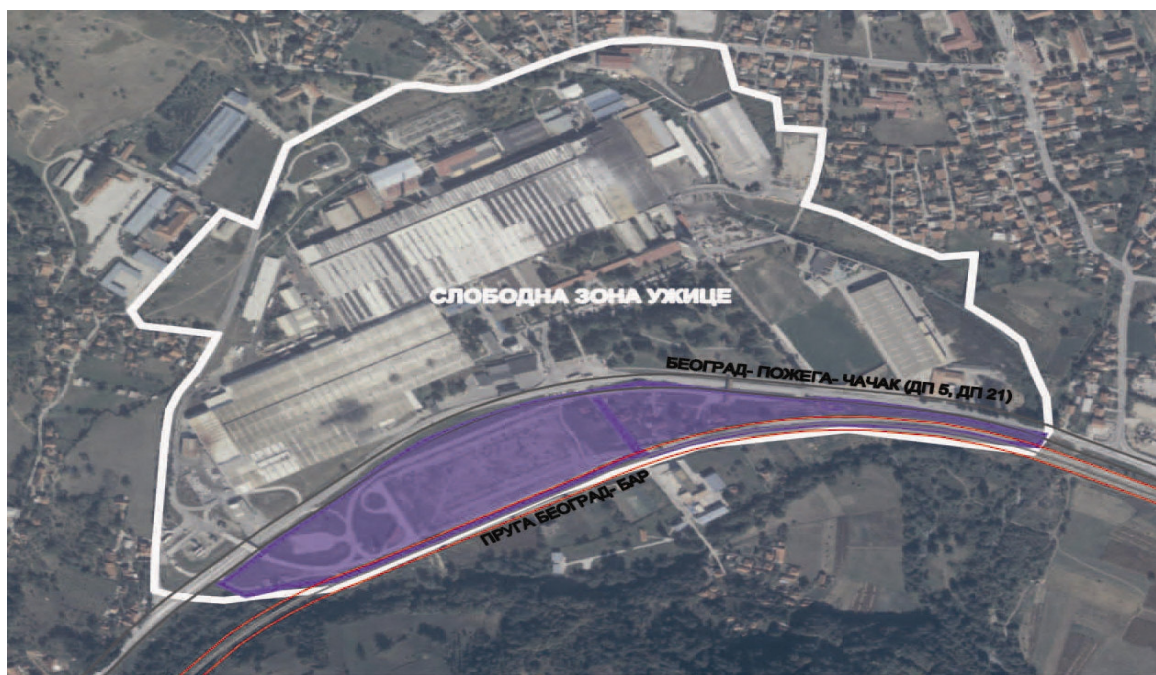
Слика 1. Једна од расположивих локација у оквиру Слободне зоне (означена бојом)

У оквиру Слободне зоне постоји низ подстицаја за улагање.