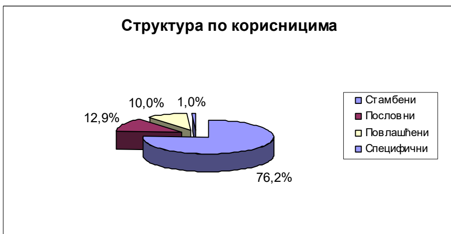
Слика бр. 2: Удео корисника по енергентима и по структури корисника у односу на укупно грејану површину