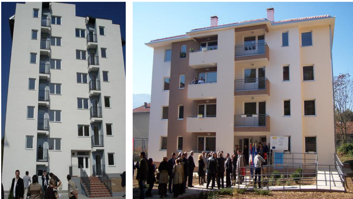
Фотографије: Стамбене зграде у насељу Севојно

Из досадашњег искуства са повратницима по реадмисији, закључено је да је реч о домицилном становништву, које је из својих личних интереса покушало да оствари статус азиланта у западно Европским земљама. Тако да град Ужице нема потребе за њиховим посебним збрињавањем.