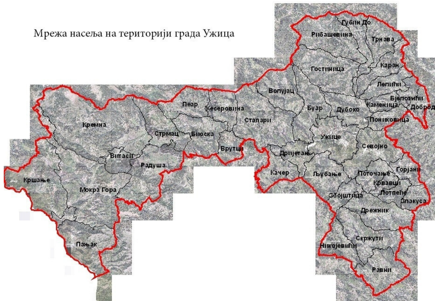
Слика 1. Скица насељених места