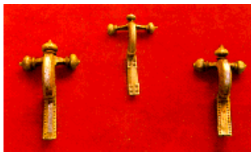
Fibule Prilipac, Bronzane krstaste fibule sa šarnirom, kojima nedostaje igla. Potiču iz četvrtog veka pre nove ere. (Narodni muzej)

Međutim, znatno veću važnost imao bi za datovanje municipiuma kod Požege jedan spomenik iz Rudog kod Višegrada, pod uslovom da se prihvati interpretacija njegovog naslova koju predlaže F. Papazoglu: