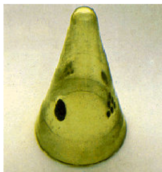
Stakleni sud Kalenić,

Na širem području Požege registrovan je veći broj nalazišta, nadgrobnih spomenika i drigih pojedinačnih nalaza. Severno od grada, u selu Otnju, nalazila se velika nekropola od koje je do danas sačuvano nekoliko spomenika. Severnije odavde, u selu Kaleniću, otkriveni su između dva rata ostaci zgrada, opeke hipokausta i drugi sličan građevinski materijal iz perioda II-IV veka n.e. Istočno od Požege, u selu Bakionici, utvrđeno je postojanje nevelikog naselja koje je bilo zaštićeno manjim kastelom na brdu neposredno iznad njega, što je, kako izgleda, do šireg gradskog kompleksa, odnosno njegovog obezbeđenja sa istočnog pravca. Odbrambenom sistemu grada pripadao bi na južnom kraju gradskog područja kastel na brdu Gradina iznad sela Prilipca, što pominje Kanitz u svojim beleškama. U zidove prilipačke crkve uzidano je