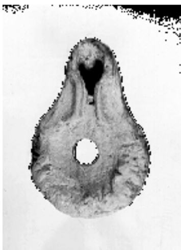
Rimska svećiljka Prilipac, Keramička rimska svećiljka, iz 4. veka, lokalitet "Obale" (Narodni muzej - Užice)

Sa teritorije Dalmacije gradskog centra kod Požege geografski je najbliži onaj iz Komina koji je, kao što je već istaknuto, bio usko povezan sa naselja na Kolovratu i, kako po svemu izgleda, do izvesne mere i sa gradom kod Požege. Sistematska istraživanja koja su na teritoriji municipiuma "S", naročito na njegovoj nekropoli, kao i na nekropoli u Kolovratu izvršena poslednjih godina, ukazuju da su oba naselja u ovoj regiji nastala sredinom II veka n.e., najverovatnije u doba Hadrijanove vladavine, što bi približno bilo negde oko 150. godine n.e. Ovakvo datovanje odgovara datovanju više municipija u unutrašnjosti Dalmacije u periodu II-III veka n.e. pa i municipiuma kod Požege, za šta se zalaže i G. Alfaldu. U vezi sa datovanjem Alfeldija, potrebno je navesti da je prilikom građevinskih radova u Užicu, na mestu zgrade nekadašnje Narodne banke, nađen jedan novčić iz doba Faustine II, ćerke Marka Aurelija (II vek n.e.), ali i jedan srebrni novčić na zapadnoj strani crkve u Arilju iz Trajanovog doba (kraj I i početak II veka n.e.), što je nesumnjivo od izvesnog značaja za pitanje osnovnih hronoloških odrednica o kojima je na ovom mestu reč.