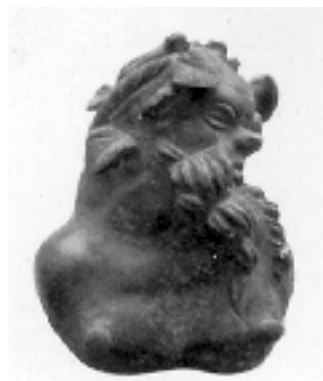
Aplika silena Visibaba,

Statueta žene u stojećem stavu. Ogrtač prebačen preko levog ramena. Krajeve ogrtača žena drži desnom rukom na desnom kuku. Antika, 2.-3. vek (Narodni muzej)