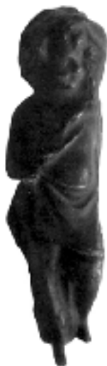
Statueta žene Visibaba,

Za Užice i njegovo šire područje daleko je, međutim, značajniji rimski municipalni centar kod Požege, zbog činjenice da je ovaj kraj ulazio u granice njegove opštinske administrativne teritorije.