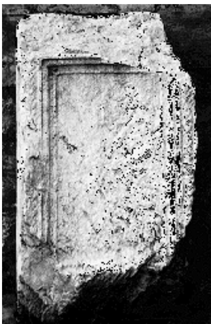
Cipus Otanj, Rimski cipus (nadgrobnji spomenik) (Narodni muzej - Užice)

utvrđeno je 10 užih lokacija od kojih, kako izgleda, svaka za sebe predstavlja posebnu urbano-arhitektonsku celinu. Na perifernom delu gradskog prostora, na mestu zvanom Blaškovina, nalazila se gradska nekropola. Od velikog broja spomenika sa ove nekropole danas su još sačuvani jedan cipus sa natpisnim poljem i reljefnim predstavama Atisa na bočnim stranama, desetak većih kamenih blokova, od kojih tri pripadaju profiliranoj arhitektonskoj plastici, kao i izvestan broj fragmentovanih nadgrobnih spomenika.