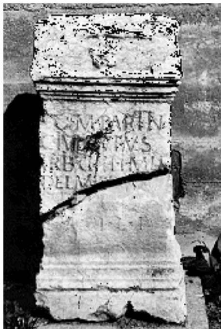
Ara Užice, Rimski kameni žrtvenik posvećen Jupiteru Partinskom (antika) (Narodni muzej - Užice)

Sa šireg područja Užica poznato nam je više rimskih nadgrobnih i zavetnih spomenika. Tako je u selu Vrutcima nađena manja profilisana ara koje više nema na prvobitnom mestu nalaza u seoskom groblju, kao i jedan nadgrobnni spomenik. Kanicovi podaci o tri rimska kastela na obližnjim visovima ovog sela za sada nisu arheološki potvrđeni. Nekoliko sličnih spomenika poznato nam je iz Bioske. Od njih su sačuvana samo dva koja se nalaze neposredno ispred seoske crkve. Od nekad velike rimske nekropole u selu Kremnima, koja se nalazila na mestu zvanom "Crkvine" u blizini Misailovića kuća, ostali su samo manji ostaci. Na nekropoli su svojevremeno nađene i baze stubova i drugi arhitektonski ostaci koji svakako potiču od manjeg antičkog svetilišta. Dalje odavde, jugozapadno od