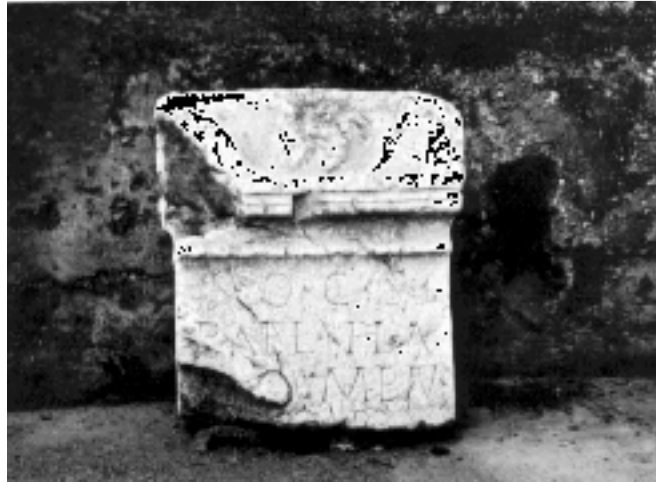
Ara Radoinja, Fragment rimske are (od 1. do 2. veka) (Narodni muzej - Užice)

zanimanje njegovih žitelja. Iako još nije pouzdano utvrđeno da je naselje na Kolovratu bilo uređeno kao municipalni gradski centar, činjenica je da je ono bilo u uskim komunikativnim, administrativnim, privrednim i kulturnim vezama sa municipiumom iz Komina, koji je zbog nedostatka podataka o njegovom punom imenu, poznat kao Municipium “S”, po početnom slovu imena grada koje se sreće na izvesnom broju spomenika.