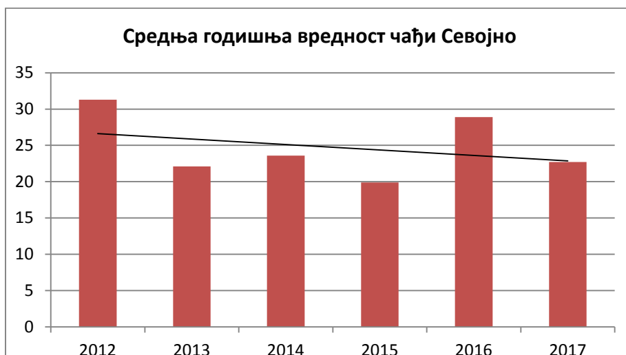
Табела 4. Број дана са прекораченим ГВ концентрација чађи на мерном месту „Зелени пијац“